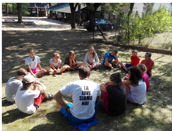
Délutáni beszélgetés a gyermektáborban

2017. augusztus 21. és 27. között került megrendezésre az idei unitárius gyermektábor, Balatonszepezden. 11 gyerekkel vágtunk neki az új helyszínnek, mely nagyon sok lehetőséget rejtett magában. A kis létszám ellenére azonban igyekeztünk, hogy semmiben ne szenvedjenek hiányt a gyerekek. A tábor témája az értékek voltak. Beszéltünk arról, hogy milyen értéket jelent számunkra a családuknak, hogy milyen kapcsolati hálót kell kiépítenünk. Természeti kincseket szemléltünk és azok értékeit elemeztük. Mindannyian egyetértettünk abban, hogy a hit, a remény, a szeretet értékei életünk igazi mozgatórugói, mert ezek az értékek teszik lehetővé, hogy értékeljük az életünket, lehetőségeinket, tehetségünket.