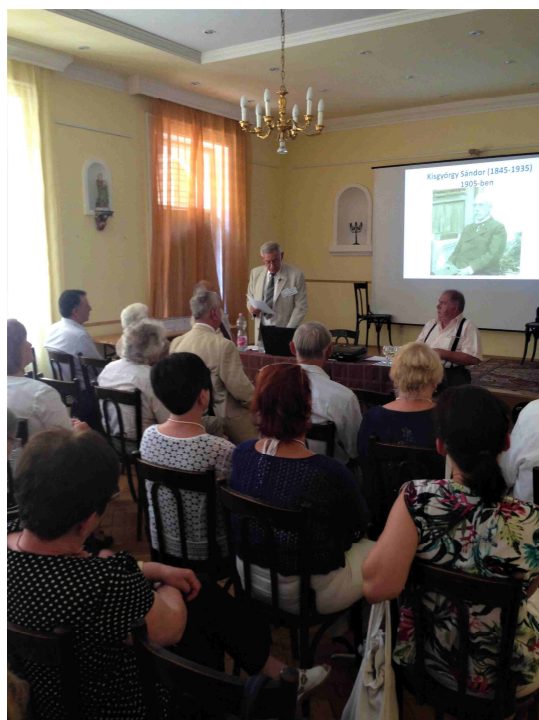
Pillanatkép a könyv budapesti bemutatójáról

részére a könyvek átadására a vargyasihoz hasonló módon. Felemelő élmény volt, hogy a szervezők a könyv ismertetését megelőzően egy rövidfilmben levetítették a jelenlévőknek a vargyasi koszorúzás rövid összefoglalóját és így időutazással a vargyasi családi találkozó résztvevőivel „együtt” énekelhettük el a székely himnuszt.