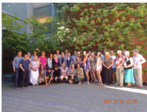
Vendégek és vendéglátók a portlandi unitárius templom udvarán

Az utolsó vasárnap közös istentiszteleten vettünk részt, ami meglepetés volt mindannyiunk számára, hiszen több a különbség, mint a hasonlóság a liturgiáink között, de mindannyiunk véleménye az volt, hogy közvetlen, őszinte és kedves volt a hangulat.