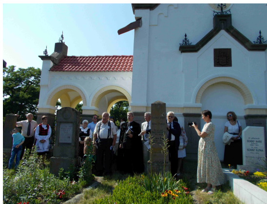
Megemlékezés az elődök sírjánál Vargyason