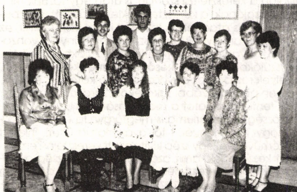
A Csíkszeredai Unitárius Nőszövetség a Nyugdíjasok Napja tiszteletére rendezett ünnepségen