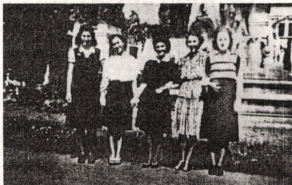
A Leányotthon növendékeinek egy csoportja