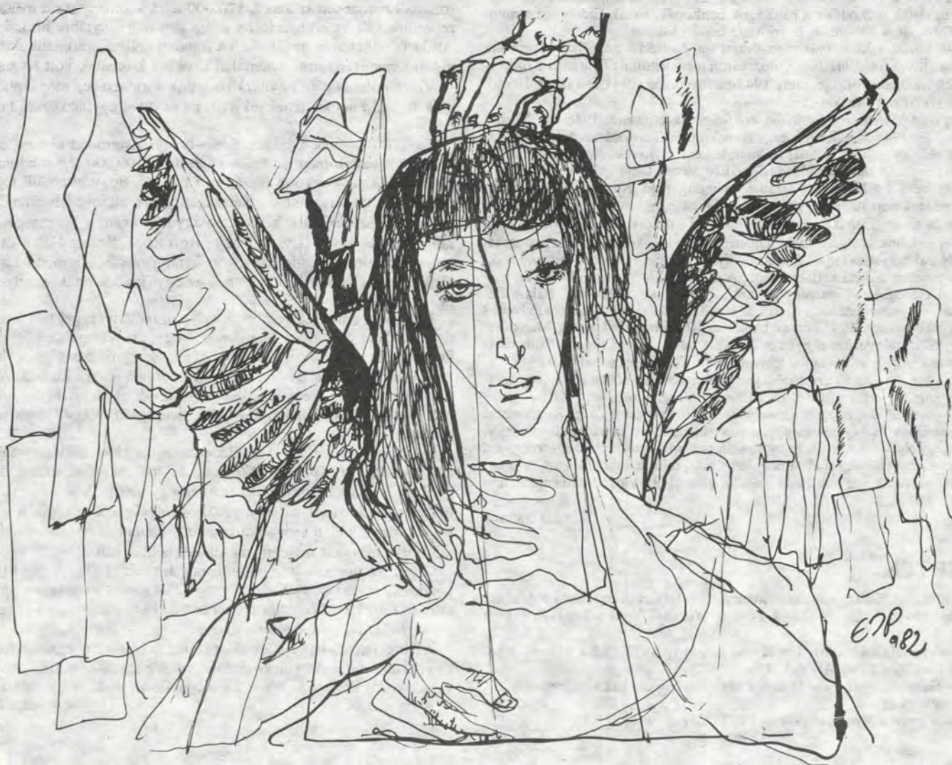
Erdős I. Pál grafikája

1938. július 1-3-án volt a XI. Ifjúsági Konferencia Kolozsváron. Targyköre: az ifjúsági mozgalom újjászervezése és az új idők szellemének megfelelő munka-program megállapítása volt. Az első előadást Erdő János tartotta: „Az ifjúság szerepe a belmissziói munkában” címen. Utána Kiss Viola beszélt az „Angol nő életéről, úgy ahogy én látom”. Ürmösi József „Szövetkezeti munka és az ifjúság elhelyezkedési lehetősége” címen tartott előadást a szövetkezeti mozgalom fontosságáról. Ezt a tárgyat Papp István előadása egészítette ki: „Az unitárius főiskolai