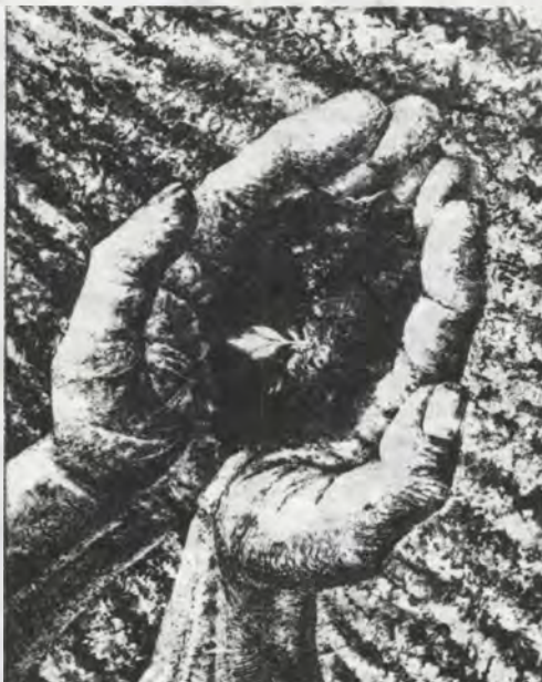
Csutak Levente: új hajítás