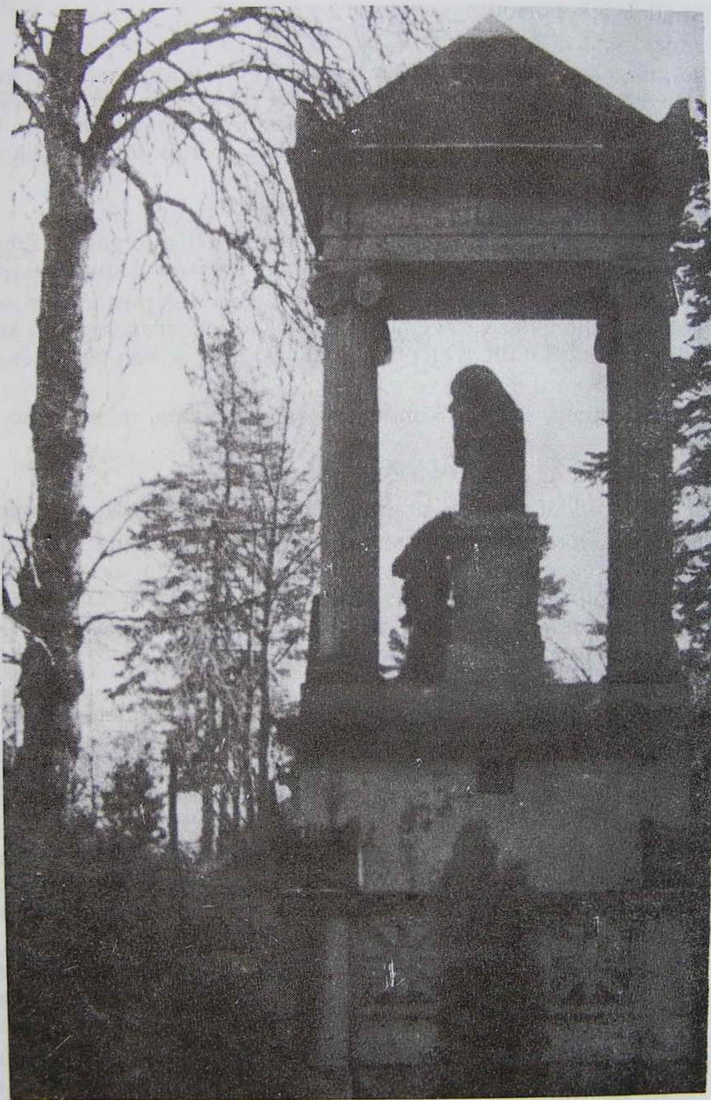
Síremléke a Házsongárdi temetőben